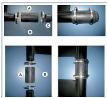
sada (pro d50)