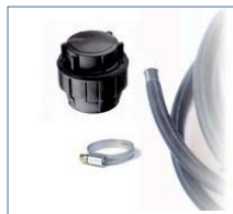
sada (pro d32)